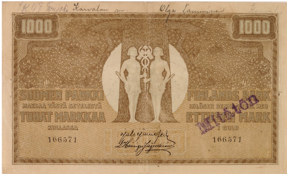
Kuva 1. Punaisen Suomen Pankin liikkeeseen laskema 1 000 markan seteli.