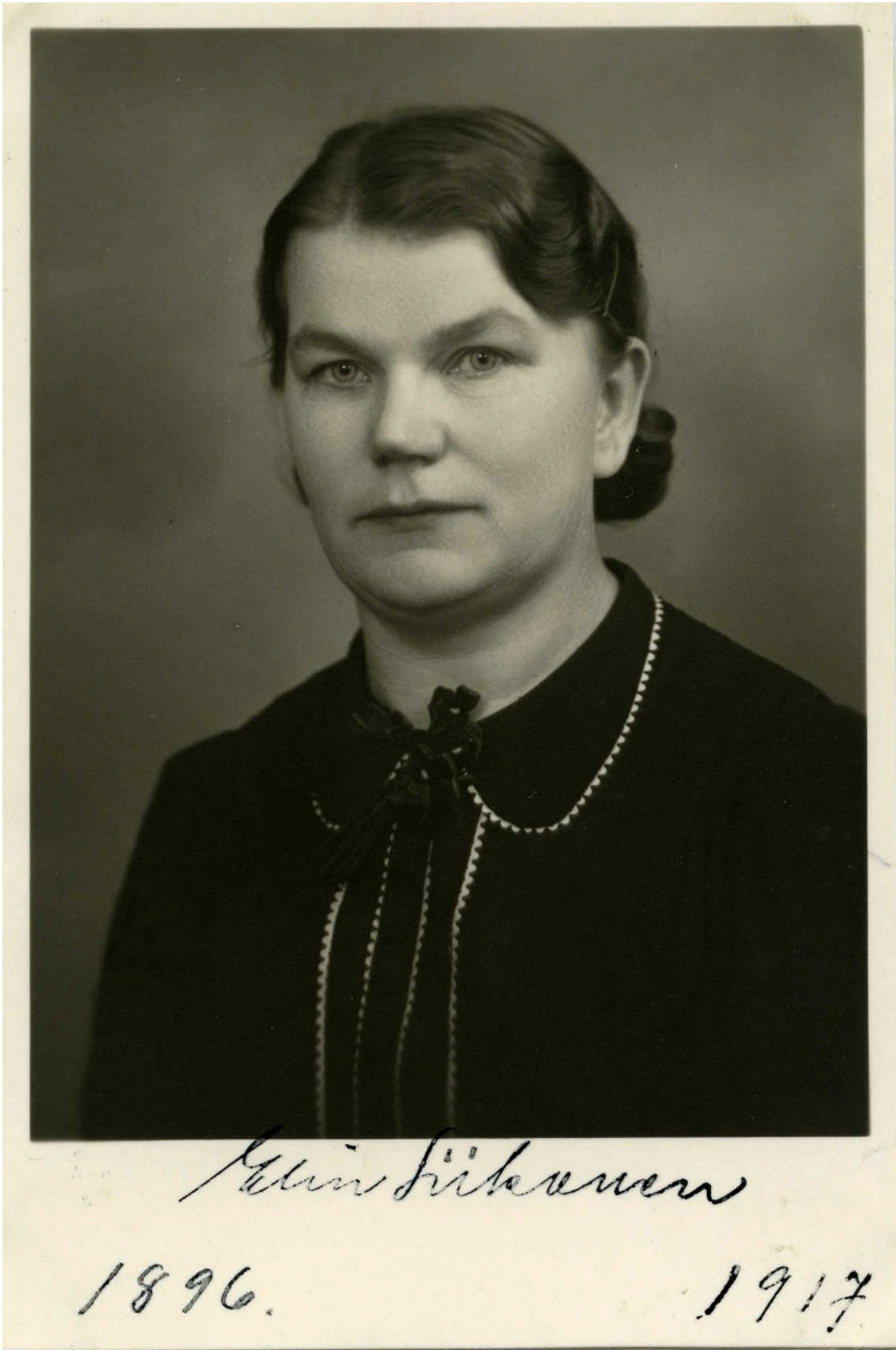
Kuva 2. Eräs ensimmäisiä pankkivaltuuston käsittelemiä asioita toukokuussa 1918 oli palkkion