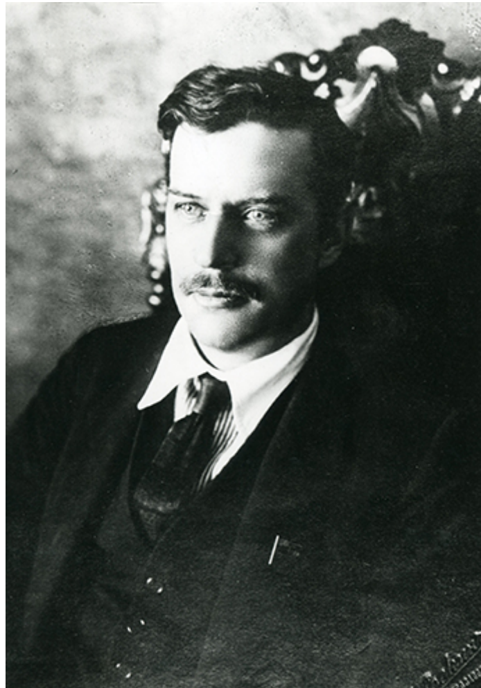
Pankkivaltuusmiesten sosialidemokraattinen puheenjohtaja Edvard Gylling.