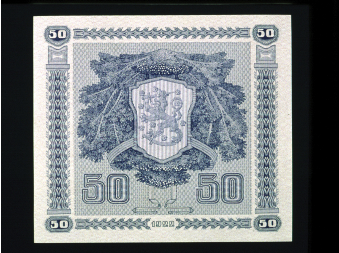
50 markkaa, takasivu.