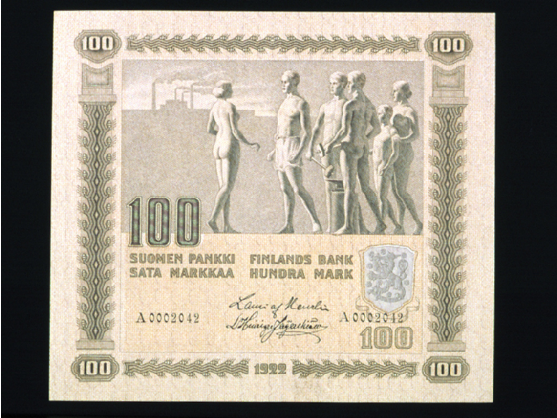
100 markkkaa, etusivu.