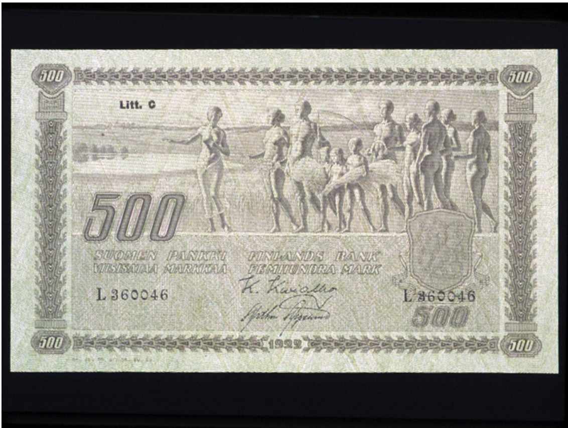
500 markkaa, etusivu.