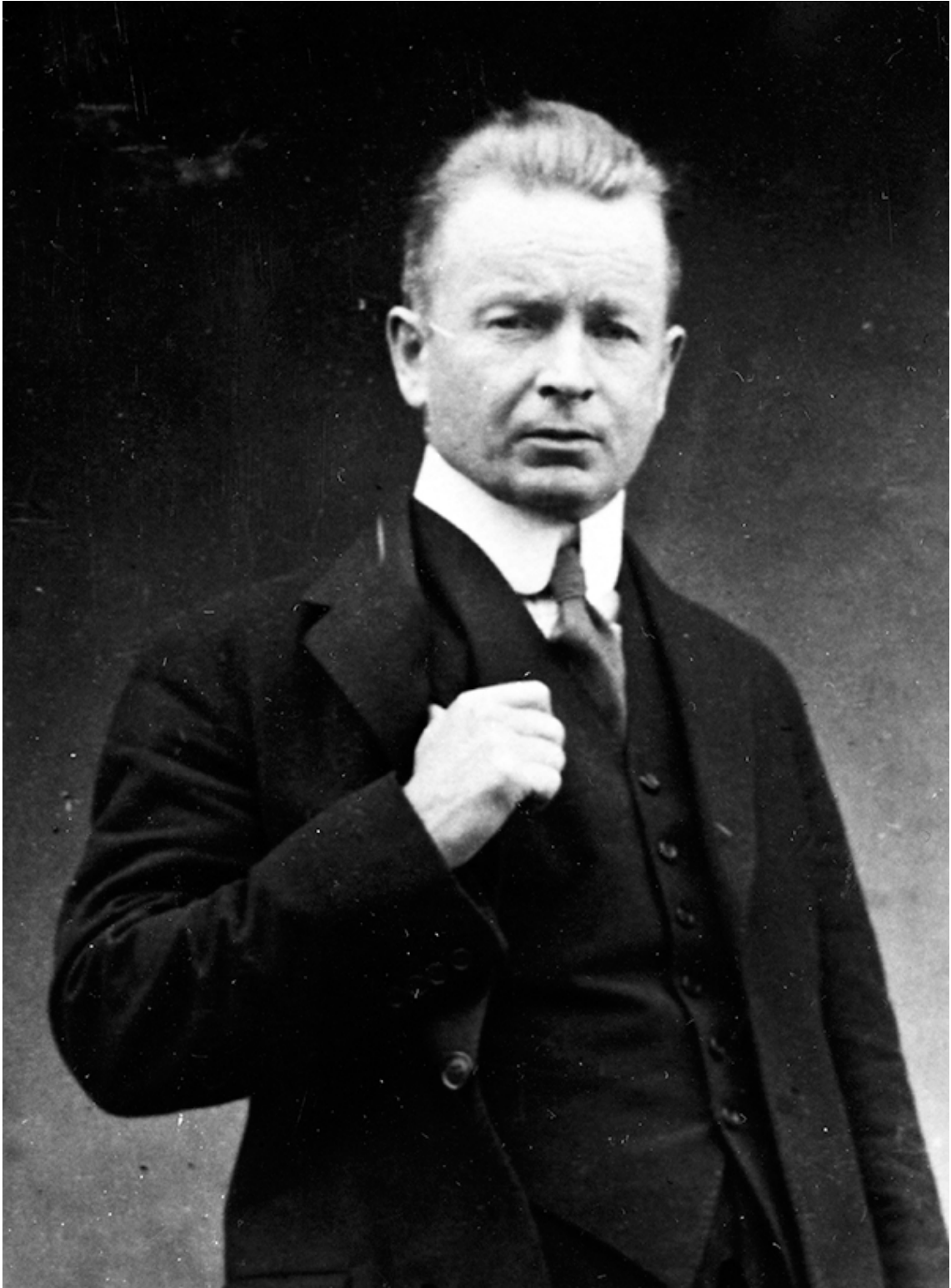
Arkkitehti Eliel Saarinen.