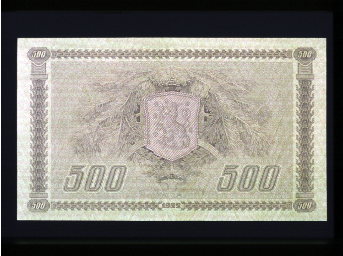
500 markkaa, takasivu.