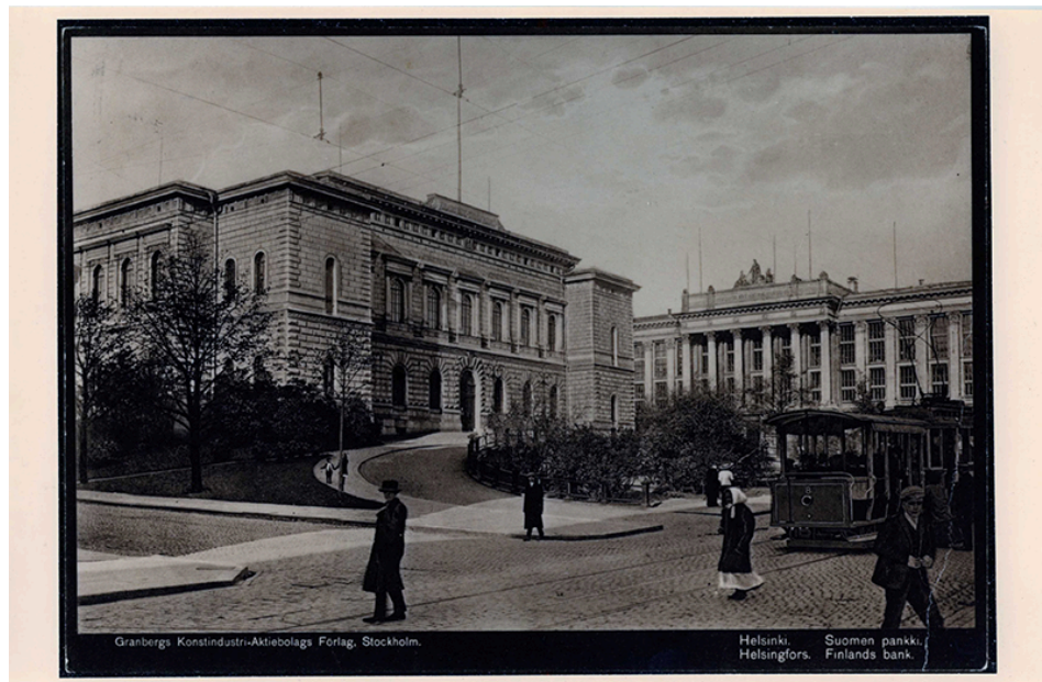
Suomen Pankin päärakennus vuonna 1910.

Tutustu pankkivaltuusmiesten 18.1.1917 pidetyn kokouksen pöytäkirjaan.