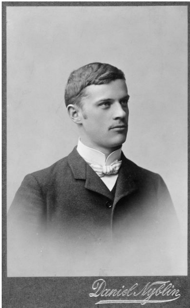
Edvard Gylling, (1881-1938). FT, tiedemies ja poliitikko.