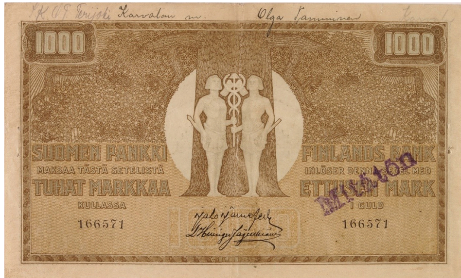
Kuva 1. Punaisen Suomen Pankin liikkeeseen laskema 1 000 markan seteli.

Punaisen Suomen Pankin liikkeeseen laskemat setelit julistettiin laittomiksi (kuva 1). Koska laittomat setelit oli mahdollista tunnistaa vain sarjanumeroista ja koska sarjanumerot olivat helppo väärentää, setelipaino laski nopeasti liikkeeseen useita korvaavia setelisarjoja. Vuoden 1918 lopussa maassa oli viisi eri versiota vuoden 1909 setelisarjasta.