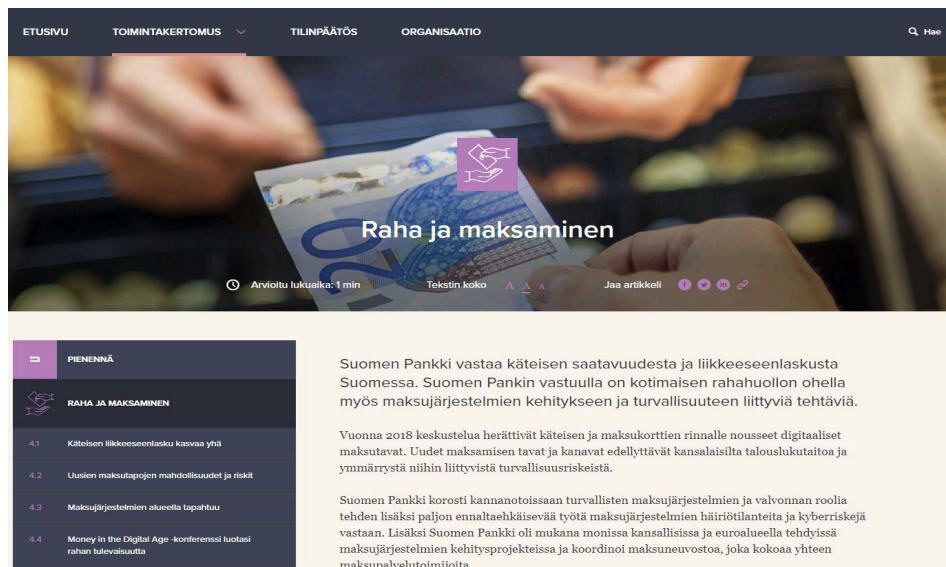
Kuva 3: Yhteenvedot tiivistivät jokaisen osion sisällön.