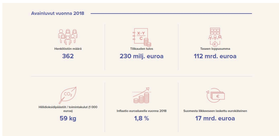
Kuva 4: Avainlukugraafit tarjoavat nopean pääsyn faktojen lähteelle.

Siirsimme vuosikertomuksen verkkoon monista syistä. Halusimme kertoa asioistamme laaja-alaisemmin, ymmärrettävämmin ja ympäri vuotta. Toisaalta olemme saaneet muun muassa Omnibus -kuluttajatutkimuksen kautta selville, että tehtäviämme ei tiedetä ja halusimme kertoa toiminnastamme läpinäkyvästi ja selkeästi. Rikastimme lukukokemusta muun muassa tarjoamalla avainlukuja yksinkertaistettuina graafeina, yhteenvedoja, luku-aika-arvioituja tekstejä kiireiselle lukijalle ja pääjohtajan videotervehdyksen videoiden kautta mieluiten asiaan perehtyjälle. Tarjoamme myös pdf-muotoista vuosikertomusta kaipaavalle mahdollisuuden nauttia vuosikertomus perinteiseen tyyliin.